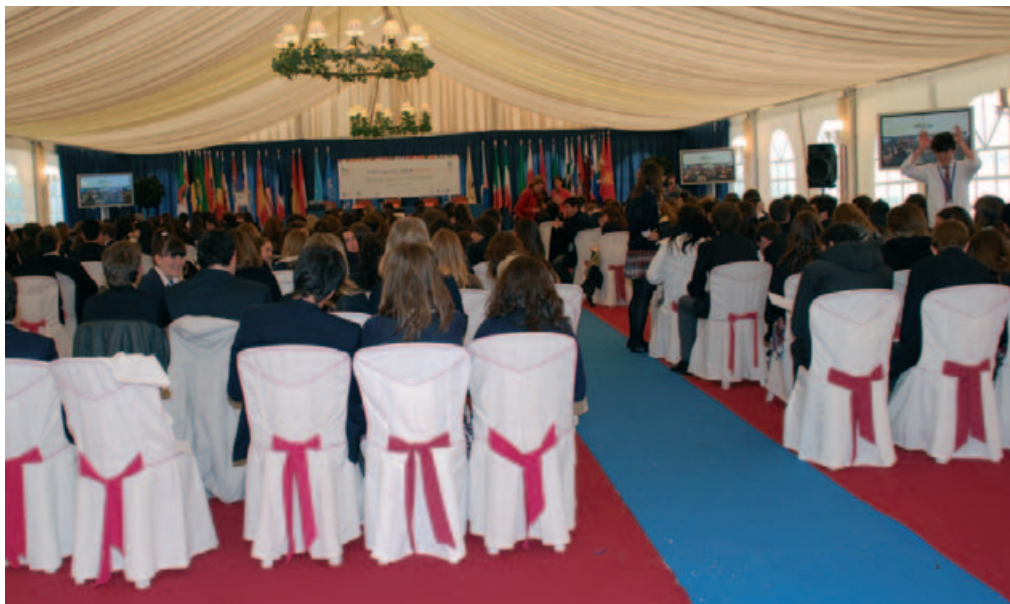
II Encuentro SEKMUN. Sesión inaugural.

Políticas de la Universidad Norteamericana de HARVARD. En los Estados Unidos de América, Canadá y los países latinoamericanos es donde el modelo tiene un mayor desarrollo. Existen varios Modelos como MINUBA, MEXMUN, en los que participan colegios de diversos países. En España se ha organizado algún modelo de Naciones Unidas con carácter universitario. Sin embargo, en estudios secundarios, salvo la Institución Educativa SEK nadie ha implantado y certificado el modelo de Naciones Unidas, a pesar de que en el resto del mundo está plenamente desarrollado.